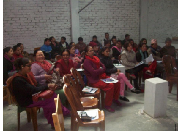
अन्तरसम्वाद कार्यक्रमका सहभागीहरू

त्यसपछि कार्यक्रमको तेस्रो तथा अन्तिम चरणमा सहभागी महिलाहरूबाट जनस्वास्थ्य निरीक्षकलाई विभिन्न जिज्ञाषाहरू राख्नु भएको थियो । विशेष गरी पाठेघर खस्ने समस्याबारे भोग्नु परेका अनुभवहरूलाई आदानप्रदान गरिएको थियो । सो क्रममा महिलाहरूको यस समस्या ज्वलन्त भएकोले यसको न्युनीकरणका लागि महिलाहरूमा सचेतना फैलाउनु पर्ने र यस्ता कार्यक्रमहरू गाविसस्तरमा समेत गर्नुपर्ने धारणा व्यक्त भएको थियो । कार्यक्रमको सवाल जवाफ चरणपश्चात आयोजकको तर्फबाट सबैमा धन्यवाद ज्ञापन सहित सम्पुर्ण सहभागी सभापतिहरूको आज्ञाले तालीका साथ घण्टी बजाएर कार्यक्रम समापन गरिएको थियो ।